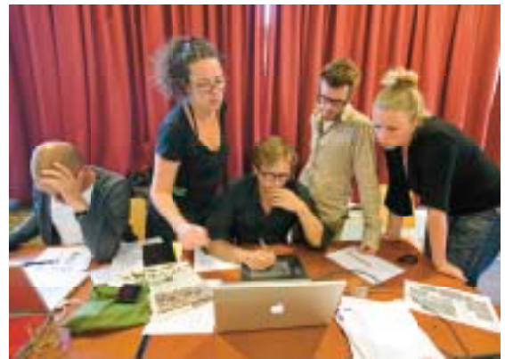
DAGKRANT REDACTIE

Elke dag van het festival verscheen de Oerol dagkrant met nieuws en updates over het festivalprogramma. De papieren versie van de Oerol dagkrant had maar één nadeel, buiten Terschelling werd hij niet bezorgd. Maar, voor alle thuisblijvers waren de dagkranten ook online te vinden.