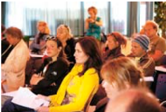
PROJECT ZUID-ZUID

In samenwerking met Stichting NORMA is een lezing georganiseerd over de naburige rechten van uitvoerend artiesten. NORMA werkt hard om vergoedingen voor uitvoerend artiesten te realiseren bij gebruik van hun 'materiaal' door derden.