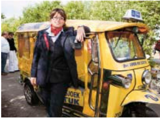
NS TUK TUK VOOR DE VRIENDEN VAN OEROL

Tevens kon Oerol dit jaar de NS verwelkomen als nieuwe subsponsor voor de duur van 1 jaar. Het partnerschap kwam tot stand naar aanleiding van de verkiezing van Oerol als winnaar van de Nationale Uitjertest via de door NS gelanceerde website Eropuit.nl. Dit eerste jaar was succesvol. De opgezette actie van gratis vervoer tussen de festivalterreinen voor Vrienden van Oerol met Tuk Tuks bleek een goede insteek; de Vrienden maakten er veelvuldig gebruik van. In totaal zijn er 1250 Vrienden vervoerd met de Tuk Tuks. De NS was zodoende zichtbaar aanwezig op het eiland. Ook hier hoopt Oerol op het begin van een langjarige sponsoring. Oerol is daarom voor de komende jaren verder met de NS in gesprek.