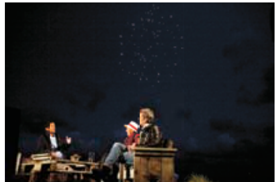
AVRO TALK SHOW

In 2009 werd de samenwerking met de AVRO verder uitgebouwd. De verschillende programma's werden qua inhoud zwaarder aangezet waardoor bij de 'thuisblijvers' een reëel beeld kon worden geschetst van deze editie van Oerol. De dagelijkse televisietalkshow Opium (van zondag 14 juni tot en met zaterdag 20 juni), met Cornald Maas als presentator, en Opium Radio op Radio 1 met Hans Smit als presentator droegen daar in belangrijke mate aan bij en bleken goed bekeken c.q. beluisterde programma's. Beiden programma's waren live en toegankelijk voor publiek, wat erg gewaardeerd werd.