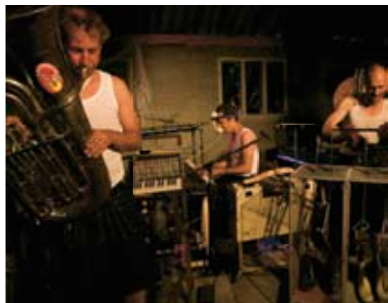
ODD ENJINEARS, BOT

Speciale aandacht verdienen verder het succesvolle beeldende muziektheaterproject BOT van Odd Enjinears & Beu en het verrassende en originele AktieMan! van De Jongens.