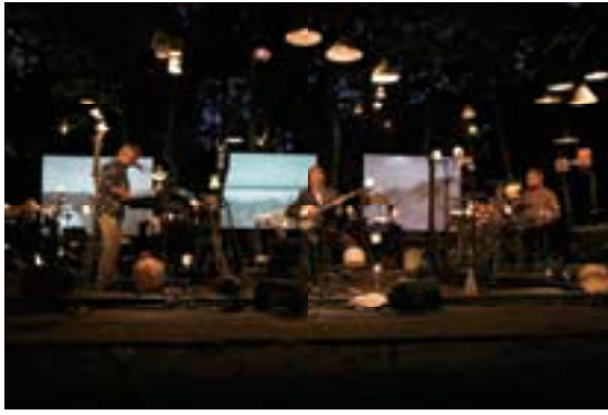
KLANKEN TUSSEN DE PLANKEN: THE NITS

In het kader van de interdisciplinaire benadering van het theaterprogramma vond dit jaar het experiment 'Klanken tussen de planken' plaats. Een nieuw onderdeel van het theaterprogramma, dat met medewerking van de muziekprogrammeurs tot stand is gekomen. Zij daagden een aantal muzikanten uit om in de natuurlijke setting van het bostheater in Formerum een niet-gebruikelijk optreden te geven. Dit resulteerde o.a. in een verrassend Hoorspel Om Te Zien van Janne Schra (Room Eleven) samen met cabaretière Paulien Cornelisse, begeleid door een gitarist. De Nits maakte tijdens Oerol een unieke videoregistratie die werd vertoond tijdens hun optreden dat met 150 schemerlampen werd omlijst. Stef Kamil Carlens (Zita Swoon) speelde akoestisch, iets wat niet alledaags is voor hem. Met gebruik van drie verschillende gitaren en een eenvoudig, zeer creatief drumkitje dat hij met zijn voet bediende, bracht hij zijn toehoorders in beroering. Dit succesvolle experiment zal in 2010 zeker een vervolg krijgen.