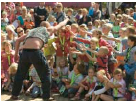
KINDERDAG GROEN ALS GRAS

Al voorafgaand aan het festival startten circa 450 leerlingen uit groep 1 tot en met groep 8 van de Terschellingse basisscholen met het Straatmuseum project. In dit project van de Vondstenfabriek verwerkten de leerlingen hun persoonlijke beleving van Oerol of de omgeving in een schilderij dat zij maakten op gejut hout.