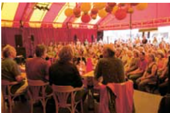
NRC KOFFIEGESPREK

Tijdens het festival vonden er gemiddeld 610 voorstellingen met kaartverkoop plaats, verzorgd door 39 gezelschappen. De kaartverkoop was verdeeld in verschillende periodes. In de laatste week van mei werd gestart met de VriendenVoorverkoop. Al op de eerste dag werden door de Vrienden van Oerol 13.500 voorstellingskaarten en ruim 3.000 Oerol paspoorten gekocht. De reguliere online kaartverkoop startte een week later. Van de in totaal ruim 100.000 voorstellingskaarten was ongeveer de helft in de online voorverkoop beschikbaar. Van de internetverkoop werd maximaal gebruik gemaakt. De rest van alle voorstellingskaarten is verkocht op Terschelling. Iedere festivaldag waren nog kaarten beschikbaar voor die dag. Met een gemiddelde bezetting van ruim 85% waren de voorstellingen goed bezocht.