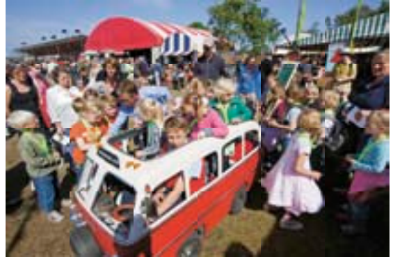
KINDERDAG GROEN ALS GRAS

Aan de oudere leerlingen werd gevraagd hun eigen schilderij een titel te geven en een brief te schrijven met uitleg van hun werk, om hiermee de communicatie tussen de kinderen en de toeschouwers tot stand te kunnen brengen. Hierna zijn de werken overal op Terschelling te vondeling gelegd. De gelukkige vinder van een kunstwerk kon tijdens Oerol op festivalterrein de Westerkeyn de bijbehorende brief lezen en een reactie schrijven aan de kunstenaar, om vervolgens het kunstwerk weer ergens anders te plaatsten voor een volgende vinder. Het project werd een unieke verbintenis tussen de Oerolbezoekers en de kinderen van Terschelling. De schilderijen vonden hun weg over Terschelling en een aantal zwierf uit naar het vasteland. Veel vindsters waren zo verguld met hun vondst dat zij het werk mee naar huis namen. Alle brieven en reacties zijn te lezen op http://straatmuseum.nl .