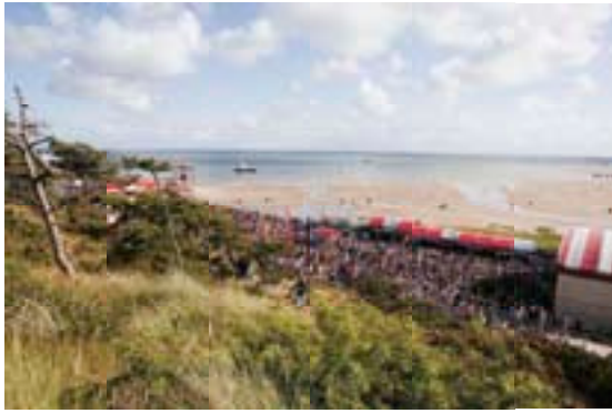
FESTIVALTERREIN HET GROENE STRAND