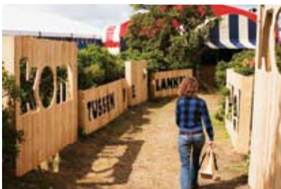
ENTREE FESTIVALTERREIN DE WESTERKEYN

Tijdens het festival experimenteerde Oerol voor het eerst met wind- en zonne-energie. Samen met Home Energy en HeijTech Services startte Oerol een pilot om te ervaren of kleine voorstellingen en publieksservices op groene energie kunnen draaien. De voorstelling van Firma Rieks Swarte & PeerGroup, die toepasselijk de titel Waai had, draaide in zijn geheel op windenergie. De toegangsweg naar de Westerkeyn werd verlicht door lantaarnpalen die van stroom werden voorzien door zonnepanelen. De bezoeker kon op de festivalterreinen de Westerkeyn en het Groene Strand met